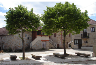
Largo do Outeiro em Tourém