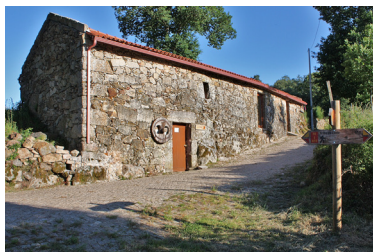
Pólo do Ecomuseu de Barroso

Pequena construção datada do século XVI, situa-se em pleno monte, fazendo fronteira com terras Galegas. Deste local é possível desfrutar de vistas magníficas.