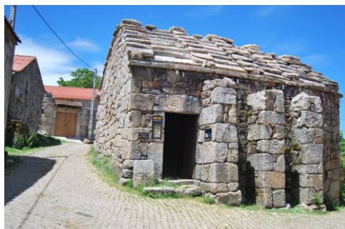
Forno Comunitário de Tourém